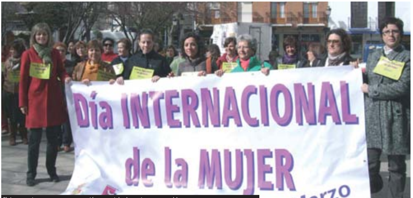
El Ayuntamiento presta una atención especial a la mujer y sus problemas

sociales básicos tenemos ya registrados 760, con especial demanda en empleo y prestaciones, por lo que cifra podría superar los 800 usuarios.