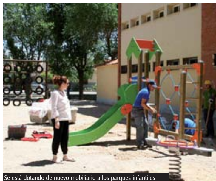
Se está dotando de nuevo mobiliario a los parques infantiles