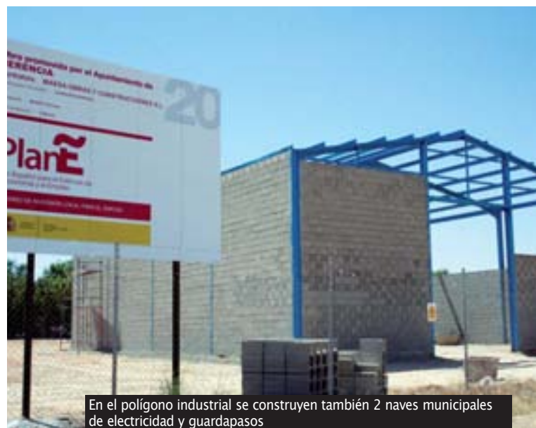
En el polígono industrial se construyen también 2 naves municipales de electricidad y guardapasos

Además se está dotando de nuevo mobiliario a los parques infantiles de la localidad, actuación que se adjudicó a la empresa Instalaciones Deportivas y Urbanas El Reino SL, con un presupuesto de 10.000 euros.