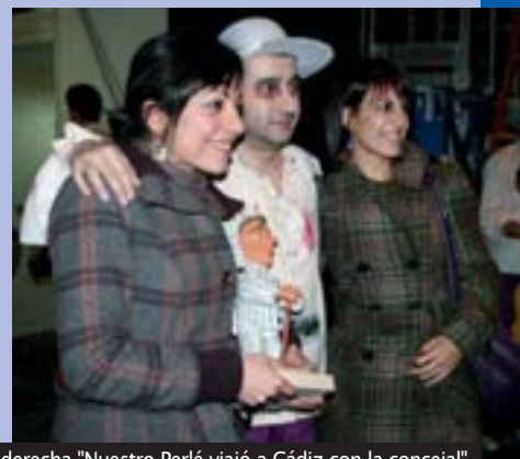
A la izquierda "El grupo con las Ninfas gaditanas en el Falla". A la derecha "Nuestro Perlé viajó a Cádiz con la concejal"