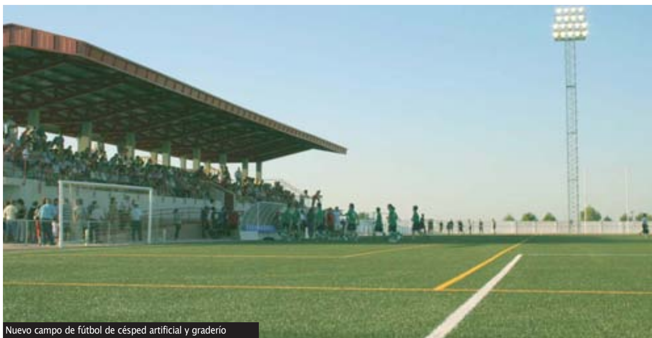
Nuevo campo de fútbol de césped artificial y graderío