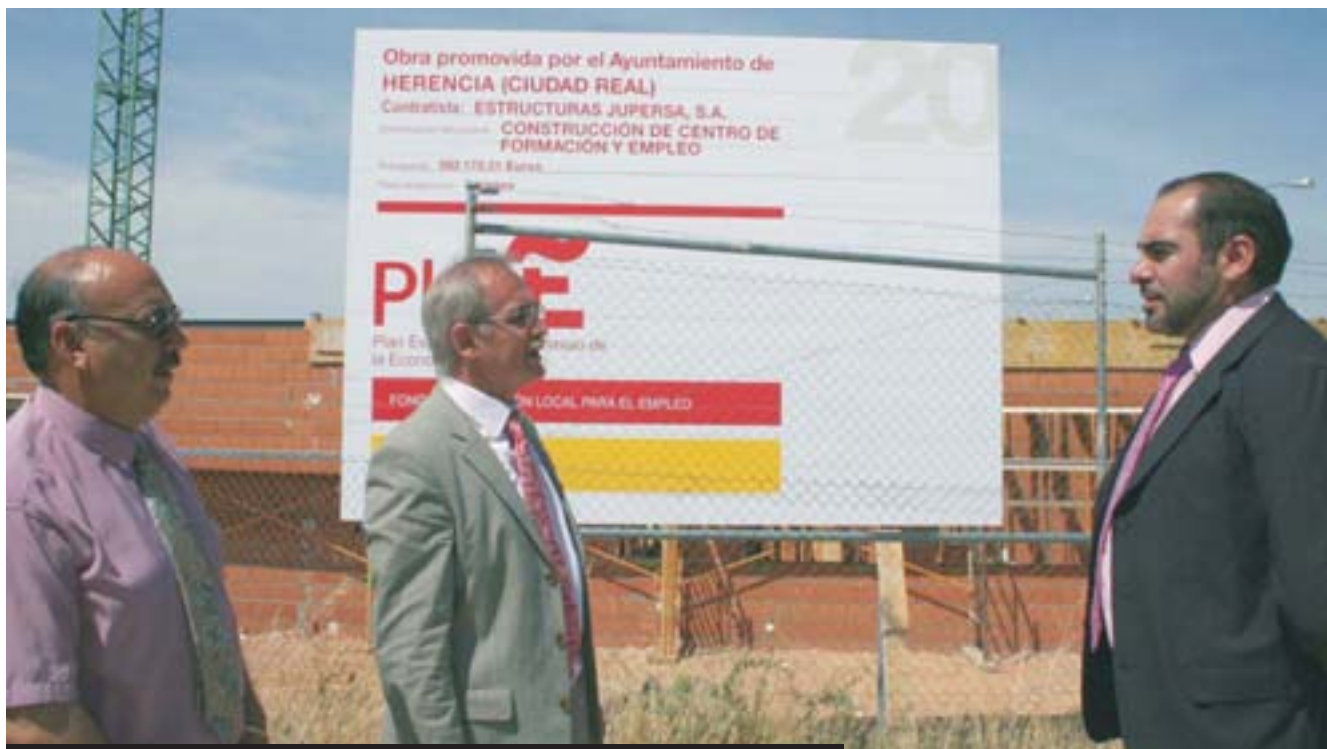
El Subdelegado del Gobierno revisa las obras del Centro de Formación con el alcalde

El equipo de gobierno tomó muy en cuenta a la hora de realizar estas inversiones el cambio de modelo productivo que se está produciendo en Herencia