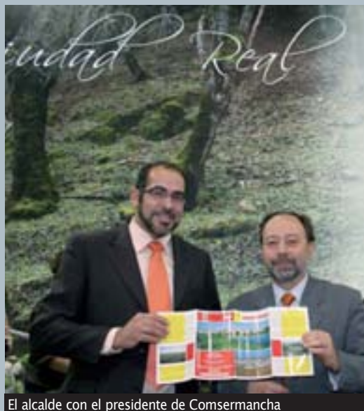
El alcalde con el presidente de Comsermancha