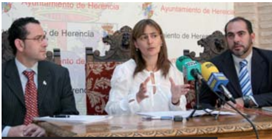
El delegado y la consejera de Trabajo, en abril, con el alcalde

Ante el aumento del desempleo debido a la crisis económica mundial durante los cuatro primeros meses de este 2009, el Ayuntamiento de Herencia y la Junta de Comunidades han puesto en marcha también medidas especiales para combatir los efectos de la recesión económica, que se cebó especialmente en el sector de la construcción y servicios, afectando a nuestra localidad. Al igual que hizo el Gobierno central a través del Plan E (ver págs. 7 y 8).