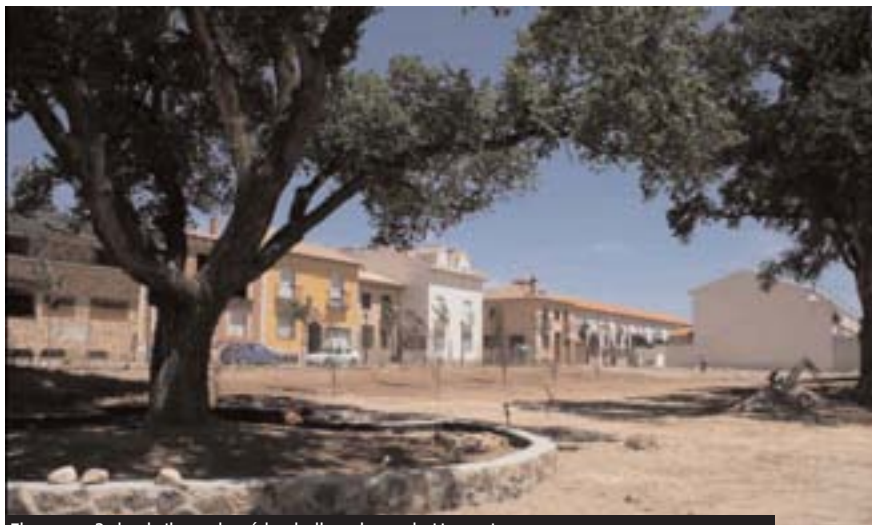
El parque 3 de abril ensalzará los bellos olmos de Herencia