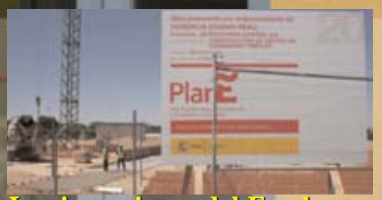
Las inversiones del Fondo Estatal avanzan a buen ritmo