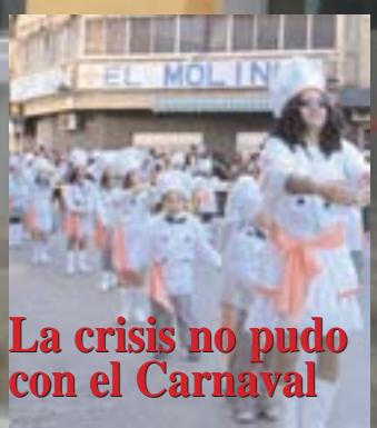
La crisis no pudo con el Carnaval