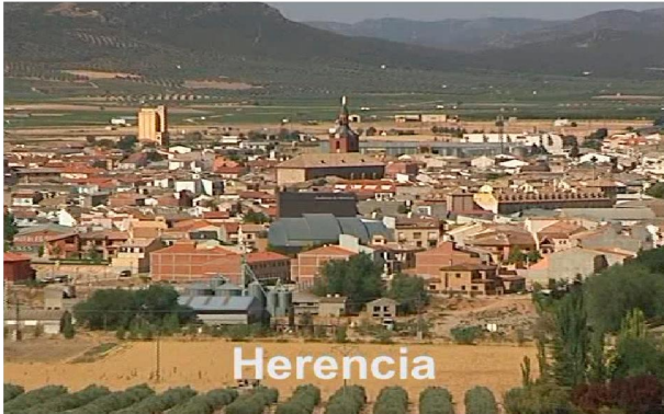
Casa de Herencia