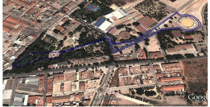
Circuito Cadete 2.575 metros.