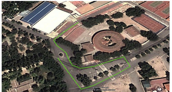
Circuito Pitufos 300 metros.