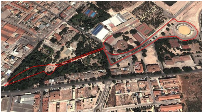
Circuito Infantil 1.675 metros.