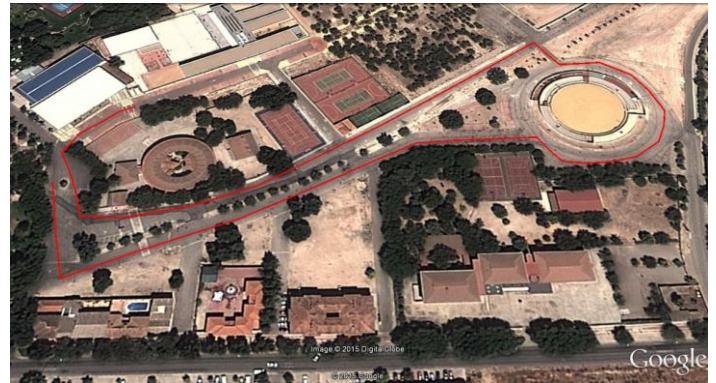
Circuito Alevín 1.000 metros.