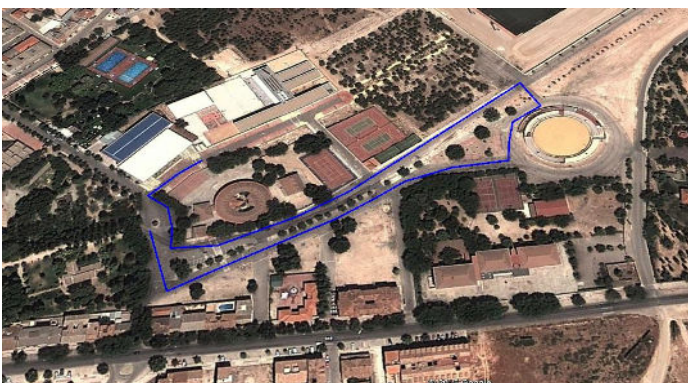
Circuito Benjamín 850 metros.