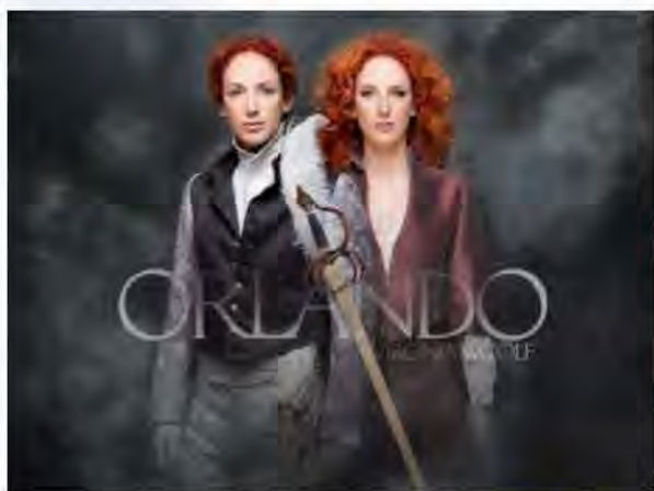
"Orlando", foto de Javier Naval.