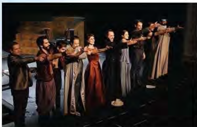
"Tito Andrónico".

Por ella habitamos los folclores, las tradiciones, los misterios y sus mitos, las supersticiones y los mundos oníricos. Esa riqueza es siempre nueva porque muda de piel, reformulada con nuestras ideas, emociones y sensaciones, para ofrecérsenos a cada uno de nosotros una y otra vez, pero irreplicable. A veces como un arañazo, o un pellizco. Otras como una caricia o un abrazo. Y esa verdad de la emoción artística, lo natural es que te atrape y ya no te suelte.