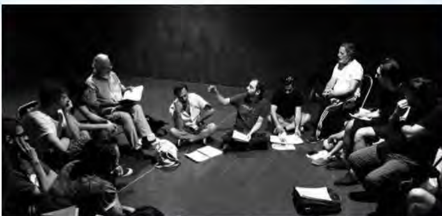
Ensayos de "Tito Andrónico".